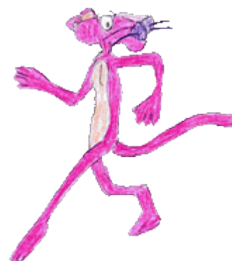
Pierwsza „Różowa Pantera” powstała w 1963 roku

Kto z Was nie zna „Różowej Pantery”? Czy uwierzylibyście, że ten lubiany zarówno przez dzieci jak i przez dorosłych film, opowiadający o przygodach roztrągniętego inspektora Clouseau